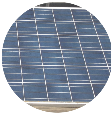
MESSUNG ALLER MODULTYPEN